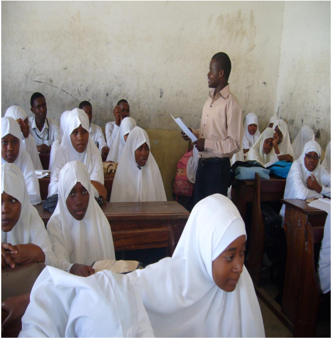
Mtafiti (Aliyesimama) akifanya majadiliano na wanafunzi wa kidato cha nne, katika skuli ya sekondari Mwanakwerekwe “C” iliyopo Wilaya ya Magharibi Unguja (Utafiti, Januari 06, 2015)