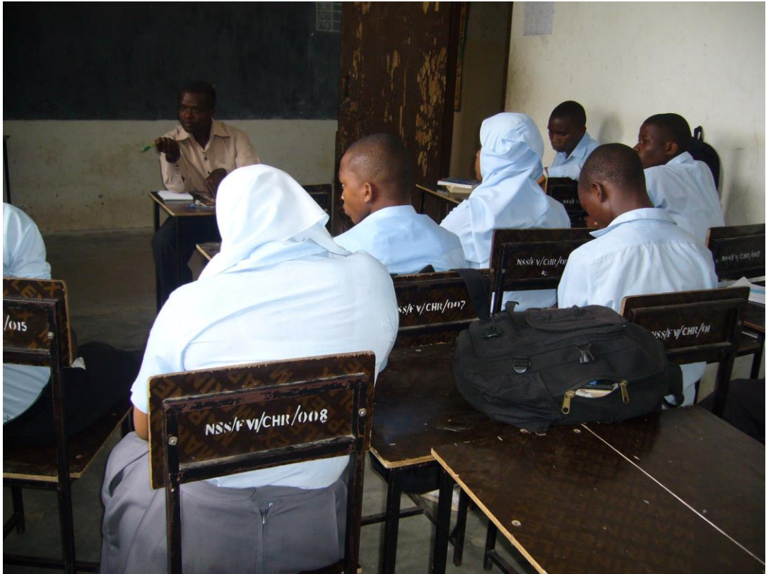
Mtafiti akifanya majadiliano na wanafunzi wa kidato cha tano wa shule ya sekondari ya Nyuki (TPDF) High School (Utafiti, Januari10, 2015)