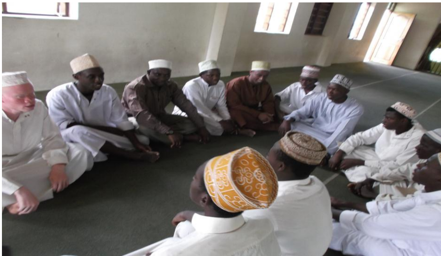
Picha namba 5: Mtafiti pamoja na wanadhikiri wakiwa katika duara wamevaa sare katika moja ya sherehe huku wakiwa katika nyiradi kabla ya kuanza mdadi katika zawia ya Msikiti Ngamia Zanzibar

Hadhara ya dhikiri huhusisha mkusanyiko mkubwa zaidi ambao huanza kwa wanadhikiri kusoma nyiradi tangulizi kama ni mwanzo wa kuanza dhikiri. Nyiradi hizo huhusisha; maulidi ya jailani, manaqibu, maulidi ya Mtume Muhammad pamoja na dua ambazo kwa pamoja hujulikana kama tartibu dhikiri . Utaratibu huu hufanywa kabla ya kuanza kudhikiri huku watu wakiwa wamekaa na kila muda unavyokwenda ndivyo mdadi wa masheikh na muridi hupanda. Baadaye wote hao huinuka taratibu kwa kuanza kudhikiri. Kama tulivyokwisha dokeza kuwa dhikiri huhusisha mkusanyiko ambao wanatariqa hukaa kwa muundo wa duara lenye wafuasi wengi, lakini hivi karibuni tumeshuhudia muundo mpya wa hadhara ya dhikiri Zanzibar.