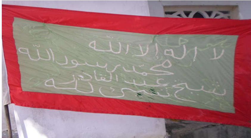
Picha namba 3: Bendera ya dhikiri yenye rangi tatu, nyeupe, kijani na nyekundu ikiwa na maandishi katikati yaliyoandikwa kwa rangi nyeupe