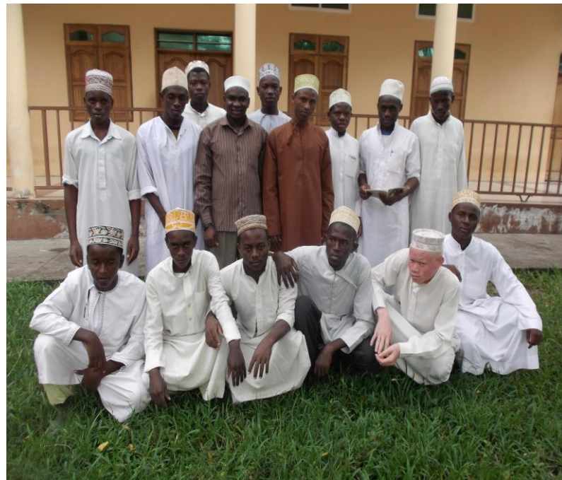
Picha namba 10: Mtafiti (watatu kushoto aliyesimama ) akiwa katika picha ya pamoja na muridi wa dhikiri katika zawiya ya Msikiti Ngamia, Zanzibar