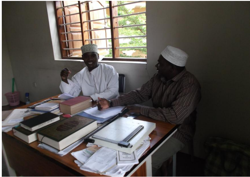
Picha namba 7: Mtafiti (kulia) akimuhoji mwalimu wa madrasat Anfal iliyopo ShauriMoyo Zanzibar (Chanzo: Utafiti, Mei 23, 2016).