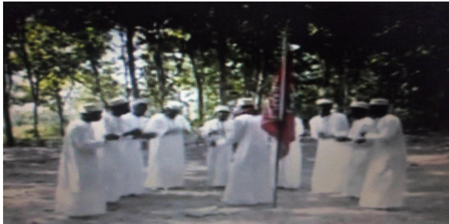
Picha namba 6: Wanadhikiri wa Madrasat Ghulam iliyopo Mwembe Makumbi Zanzibar wakionesha mtindo mpya wa kudhikiri kwa kuwa na idadi ndogo ya wafuasi.

Madrasat Ghulam iliyopo mtaa wa Mwembe Makumbi Zanzibar, ni moja ya kikundi cha dhikiri chenye chenye maudhui na malengo ya kibiashara, ambacho hudhikiri huku kikiwa na wafuasi wachache takriban tisa ama kumi na siyo mkusanyiko mkubwa kama ilivyo zoeleka. Katika uanzwaji wa dhikiri, wao huanza moja kwa moja na kudhikiri na sio kuanza kwa kusoma nyiradi kama inavyoanzwa dhikiri za tokea asili. Wenye shughuli waliolipia hawahitaji kasida itawapotezea muda wao wanataka dhikiri ianze ili wafaidi midenguu na mipasho ya maneno yake. Hali hii inaonesha kwa namna gani mabadiliko yalivyoikumba dhikiri Zanzibar.