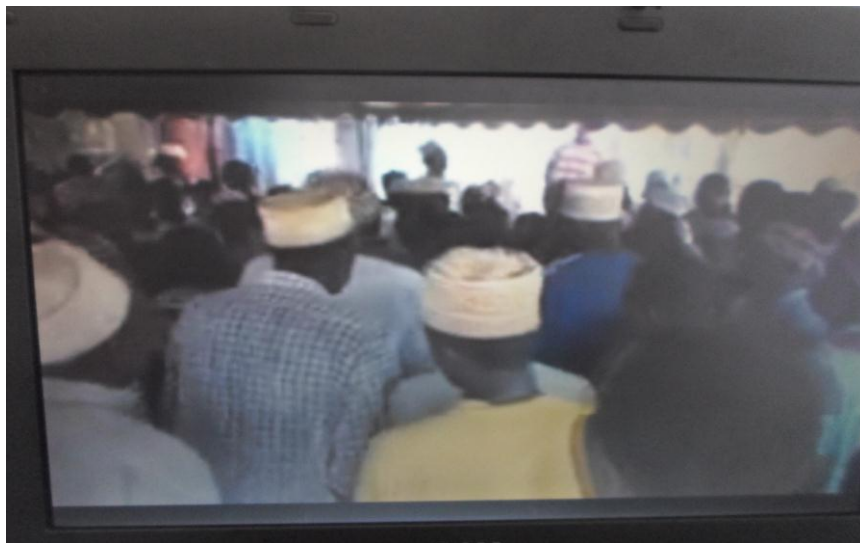
Picha namba 8: Wanadhikiri wakiwa hawakuvaa sare maalum katika sherehe maalum ya dhikiri huko Tumbatu, Mkoa wa Kaskazini Unguja, Zanzibar.