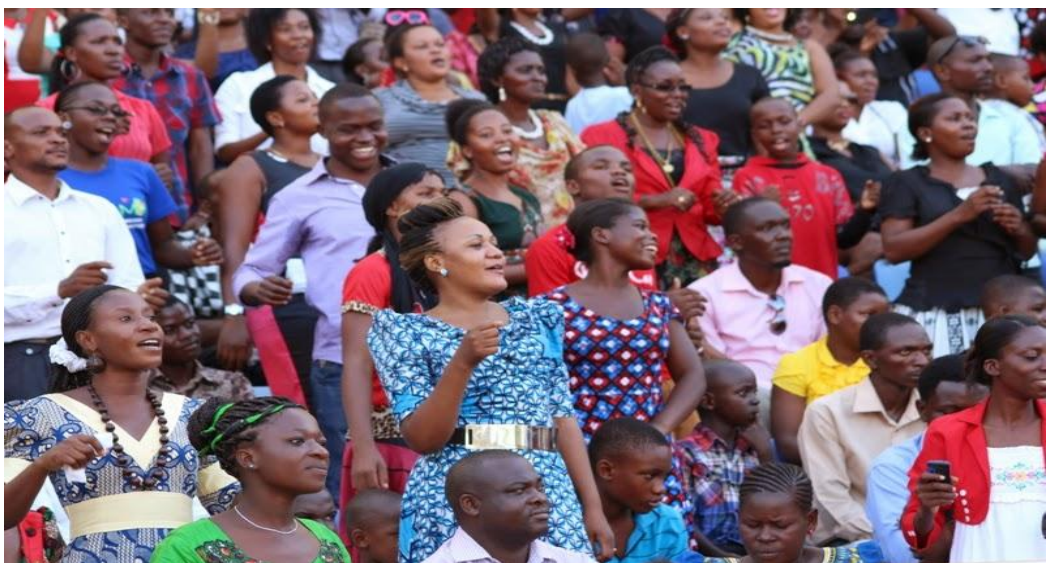
Mashabiki wa nyimbo za Injili wakiwa katika tamasha la Krismasi jijini Dar es Salaam (Utafiti, 2016)

Utafiti umebaini kuwa, nyimbo za Injili zinapokelewa kwa kiasi kikubwa sana katika jamii ya Watanzania. Hii imetokana na uamsho wa watu miaka ya hivi karibuni kutambua nguvu ya Mungu iliyoko ndani ya nyimbo hizo. Na nguvu hizo mara nyingi huwa zimebeba dhamira zinazohusu maisha ya watu kwa jumla. Hali hii imesababisha kupendwa kwa nyimbo za Injili kwasababu ni nyimbo zinazoendana na maisha ya kila siku. Kuwepo kwa matamasha mengi ya nyimbo za Injili hivi sasa ndiyo kunasababisha watu kupokea nyimbo hizo kwa kiasi kikubwa. Picha ifuatayo inaonyesha watu wakiwa kwenye tamasha la Injili la Krismasi lililofanyika tarehe 25/ 12/2015 jijini Dar es Salaam.