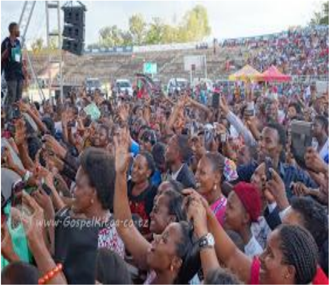
Picha 1: Wapenzi wa Nyimbo za Injili wakiwa kwenye Tamasha la Christina Shusho (Utafiti, 2016)