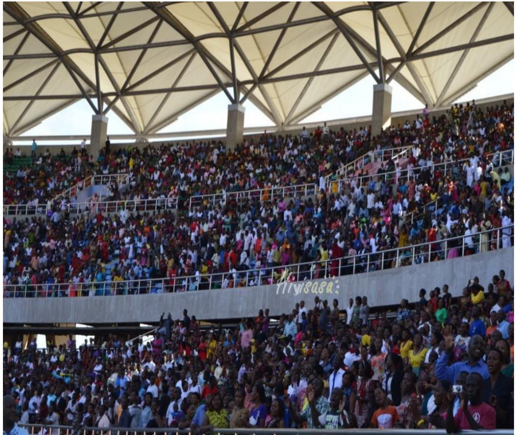
Picha 4: Wapenzi wa nyimbo za Injili wakiwa kwenye tamasha la Twenzetu kwa Yesu