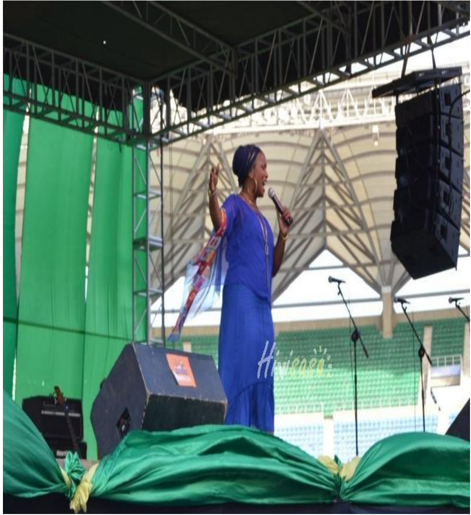
Picha 2: Mwimbaji Christina Shusho akiwa jukwaani picha kutoka mtandaoni