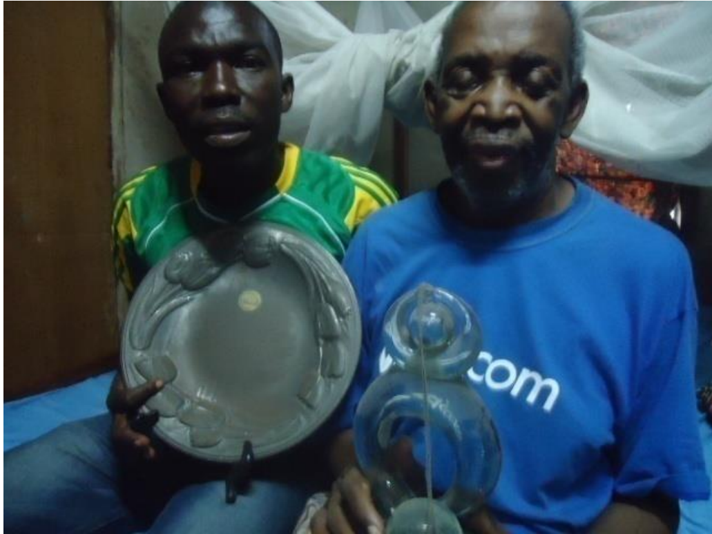
Kilelezo Na 6: Mtafiti akiwa na Andanenga na baadhi ya tuzo za mshairi huyo.