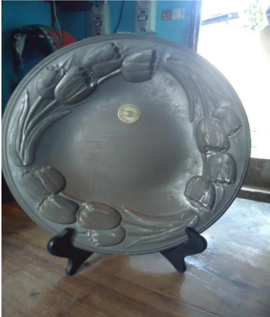
Kilelezo Na 8: Tuzo ya nguli wa ushairi 2003.